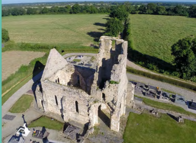
La magie de la "Cathédrale des Rotz"