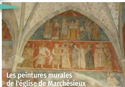
Les peintures murales de l'église de Marchésieux