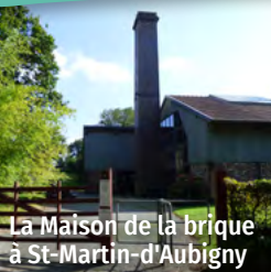
La Maison de la brique à St-Martin-d'Aubigny