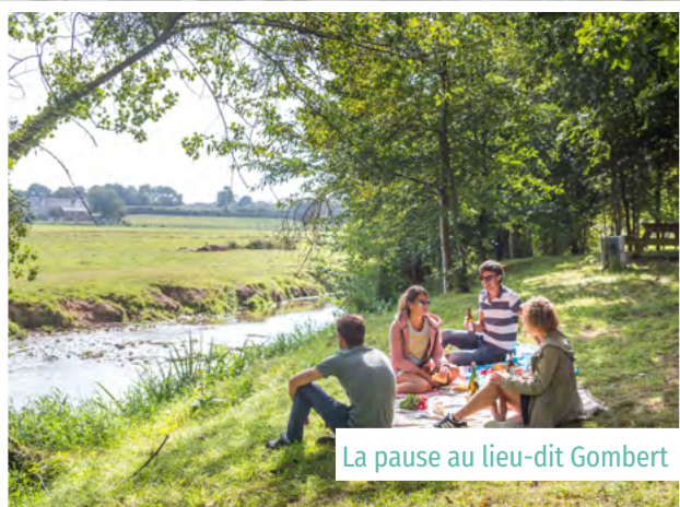
La pause au lieu-dit Gombert