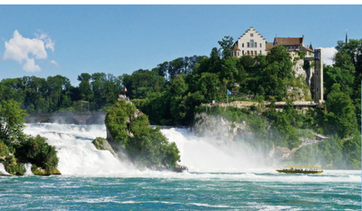
Les chutes du Rhin